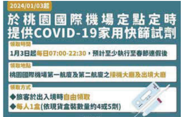
圖三 桃園機場定時定點提供家用快篩

解 答： 疾管署表示，因應近期全球呼吸道疾病發生率上升，且農曆春節將至，預期未來入出境旅客數將驟增，可能增加病毒傳播風險，為保障民眾健康，疾管署宣布自明(3)日起，於桃園國際機場定點定時提供每人1盒COVID-19家用快篩試劑予入出境旅客自由領取(圖三)，供旅客於有症狀時使用，以及時分